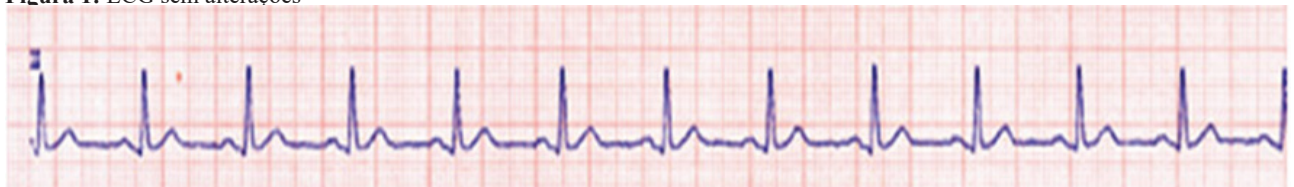
Figura 1: ECG sem alterações

O diagnóstico do IAM ocorre pelos fatores de risco anteriormente descritos, e pela detecção de alterações em exames subsidiários, como eletrocardiograma e exames de sangue capazes de detectar a morte das células musculares cardíacas (KALIL FILHO, 2009).