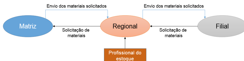
Figura 1 - Fluxo de solicitações de materiais

Com relação aos níveis de estoque da empresa, a resposta obtida foi de que a matriz mantém níveis de estoque necessários para atender a demanda das regionais e que os setores de suprimento e de estoque, da matriz, mantêm contato direto com fornecedores, fazendo pedidos em grande escala para toda a empresa, abastecendo as regionais a partir de pedidos das reservas, de acordo com a demanda solicitada. Foi explanado que as regionais não possuem contato direto com fornecedores, exceto em casos de materiais que a regional precise e o estoque da matriz não tenha. Outro ponto, as solicitações de materiais obedecem um fluxo entre matriz e filial, intermediada pelo profissional do estoque da regional, conforme Figura 1.